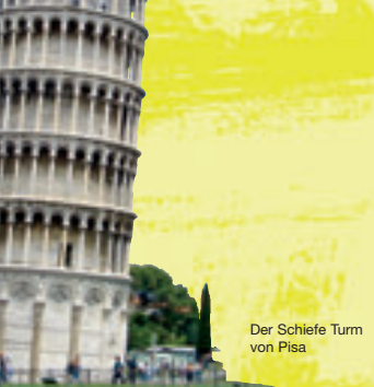
Der Schiefe Turm von Pisa